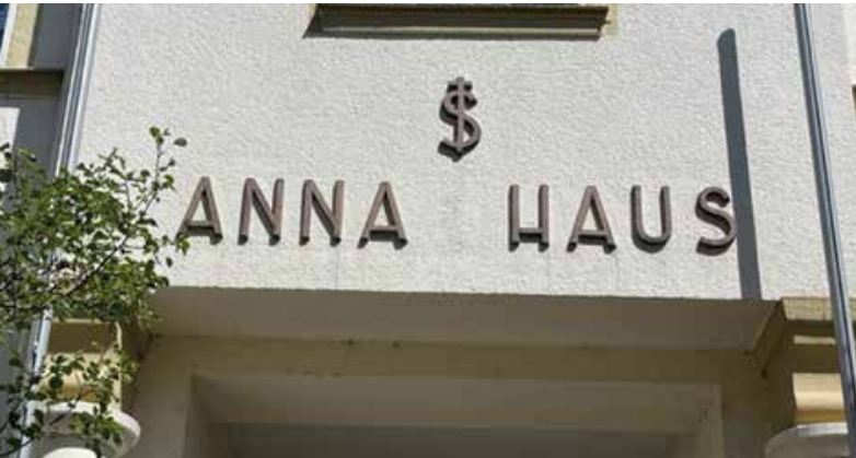
Anna Haus, Eingang Nonnengasse Hadamar