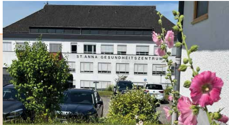
St. Anna Gesundheitszentrum Hadamar

Das Anna Haus in Hadamar - Kloster für verschiedene Ordensgemeinschaften, Krankenhaus, Schule, Geburtsklinik, Hospiz, Ort der Heilung, Ort der Pflege, Wohnhaus, ein Ort am Anfang und am Ende des Lebens, Ort des Lernens, Ort der Spiritualität, Ort des Glaubens, ein Ort der Gemeinschaft, ein Ort von existenziellen Erfahrungen, ein Ort der Freude und Trauer