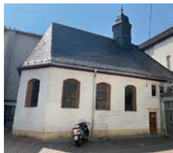
Sankt Anna Kapelle Hadamar